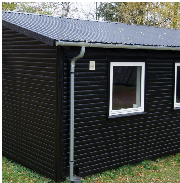
Billeder af Mikrohytten med nyt tag